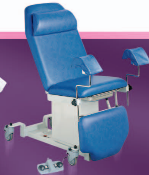
625 04T + ACC964 + SL0964 + ACC32660 + ACC990