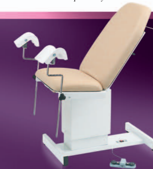
625 03T + ACC 964