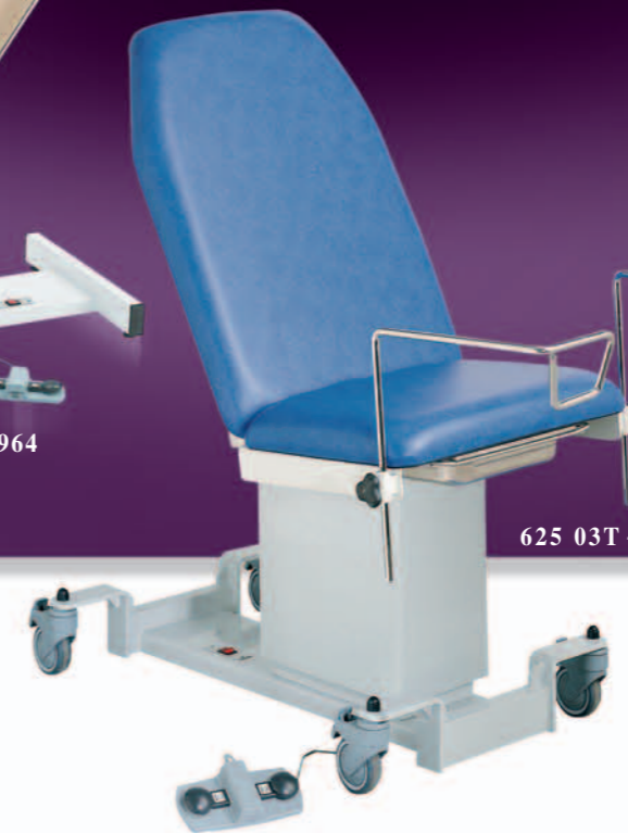
625 03T + ACC990