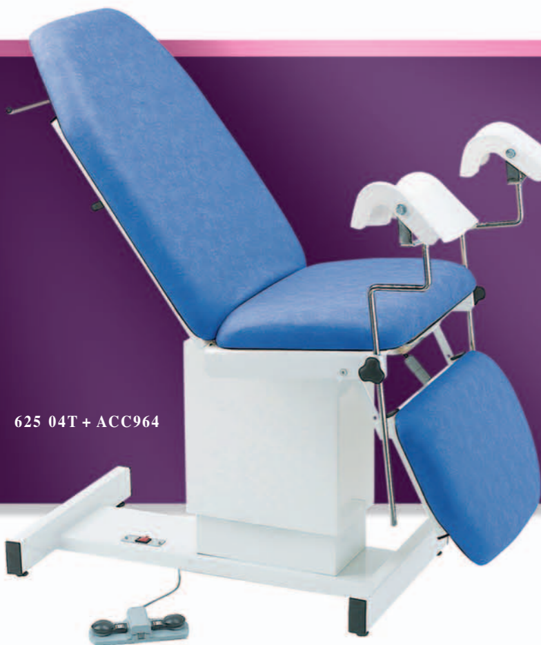
625 04T + ACC964